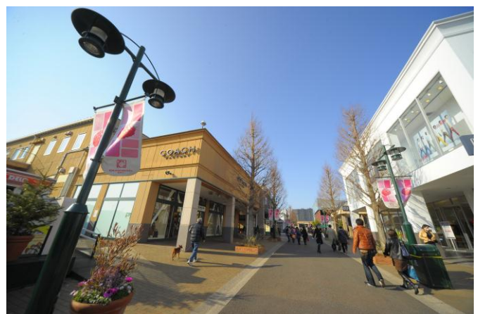
グランベリーモールの外観