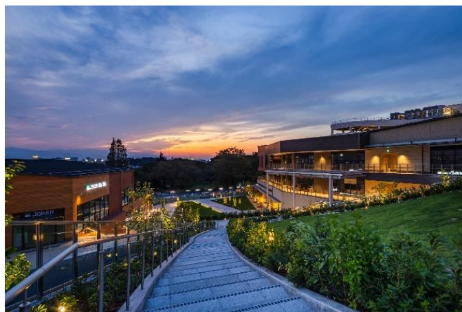
▲グランベリーパーク内広場から見える鶴間公園方向

本プロジェクトは、田園都市線「南町田グランベリーパーク駅」(2019年10月1日に「南町田駅」から改称)南側に広がる鶴間公園と2017年2月に閉館したグランベリーモール跡地を中心とする約22haのエリアについて、官民が連携し、都市基盤・商業施設・都市公園・駅などを一体的に再整備・再構築し「新しい暮らしの拠点」の創出に取り組むまちづくりプロジェクトです。