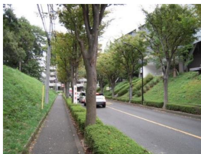
▲南1604号線※2018年6月に廃止