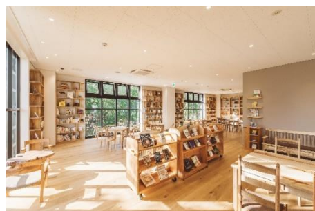
▲まちライブラリー