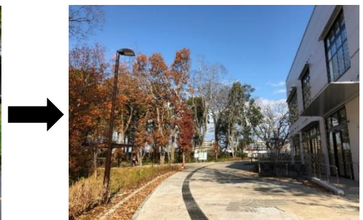
▲パークライフ・サイト内歩行者空間