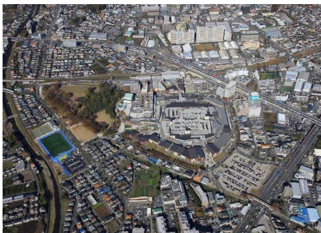
▲「南町田グランベリーパーク」地区全景