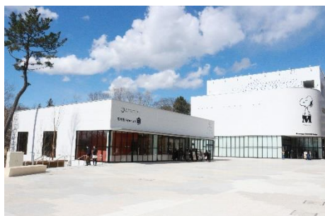
▲パークライフ・サイト (c) Peanuts Worldwide LLC

土地区画整理事業により公園と商業街区との間の道路を再配置した後、公園と商業施設をつなぐ新しいまちの中心エリアを構築するため、町田市宅地 約5,000㎡を換地し、「パークライフ・サイト」と名付けた文化的活動の拠点を創出しました。市民・来街者の多世代が会い、学び、活動できるコミュニティ創生の拠点となることをめざし、株式会社ソニー・クリエイティブプロダクツの事業参画を得て、「スヌーピーミュージアム」を核とし、図書を通じたコミュニティ醸成の場である「まちライブラリー」、児童館「子どもクラブ」など多様な機能が同居しています。また、本棚や椅子などのファニチャーに、整備に伴い公園などで伐採することになった木を活用したことも特徴のひとつです。