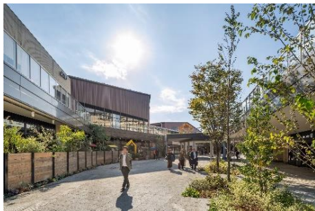
▲商業施設「グランベリーパーク」通路

大規模商業施設で重要となる駐車場は、ステーションコートでは改札階より下に、セントラルコートでは広大な丘状の敷地の中心に配置することで、駅を降りてから公園へ至る歩行者に駐車場の存在を感じさせないように配慮しました。駅と公園、そして周辺の住宅地をつなぐグランベリーパークは、旧「グランベリーモール」同様オープンモール型とし、商業街区を回遊する歩行者通路に面し、低層の分棟式の建物が立ち並びます。商業街区外周部の壁面は、外周道路からセットバックさせることで圧迫感を軽減し、仕上げを自然調のデザインとしています。