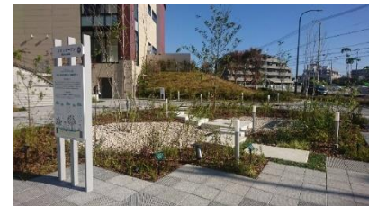
▲レインガーデン(窪地状の植栽帯)

都市型豪雨や台風への対策が求められる昨今、調整池や雨水貯留槽などの従来型の流出抑制策に加え、エリア全体にわたり、グリーンインフラによる雨水管理計画を施しました。このことは、国際的な環境認証システム「LEED-ND(まちづくり)」においても、高い評価を受けています。