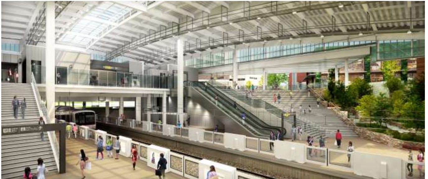
▲まちの玄関口としてリニューアルする駅構内イメージ

公園や商業施設と融合した開放的な駅空間にするとともに、エスカレーターやホームドアを設置し、お客さまの安全性と利便性の向上を図ります。