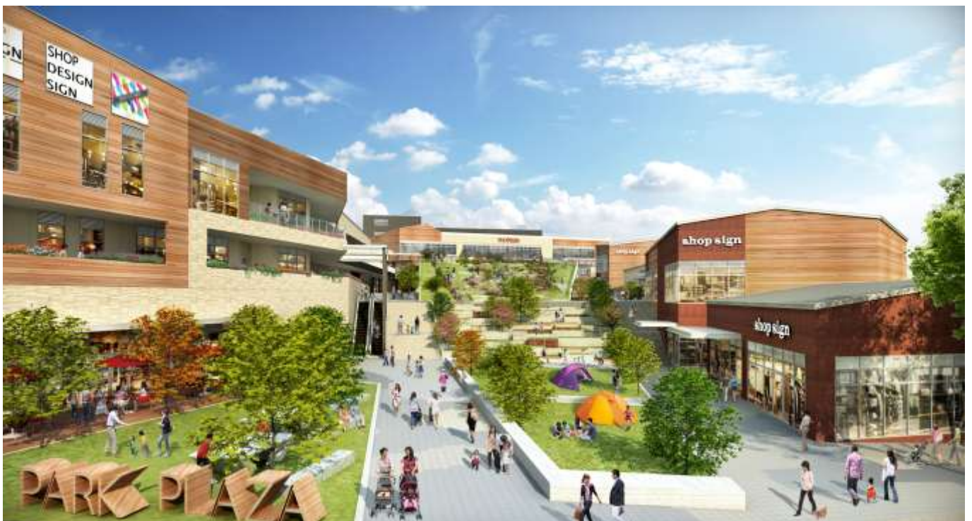
▲隣接する鶴間公園につながる自然豊かな広場イメージ