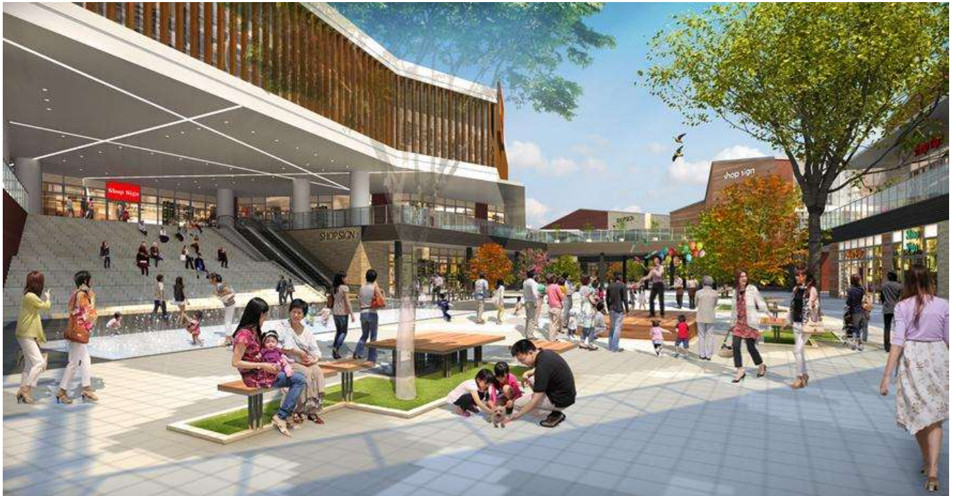
▲アーティストやパフォーマーによるイベントでにぎわう広場イメージ