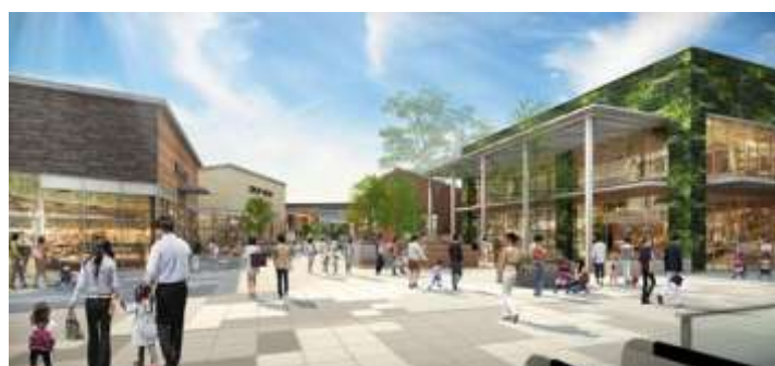
▲改札前からの商業施設を望むイメージ