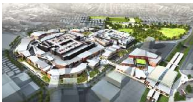
▲本計画 俯瞰イメージ