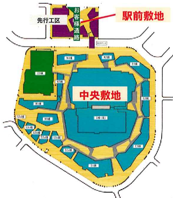
工事施工箇所案内図