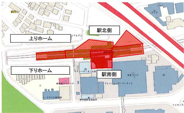
工事施工箇所案内図